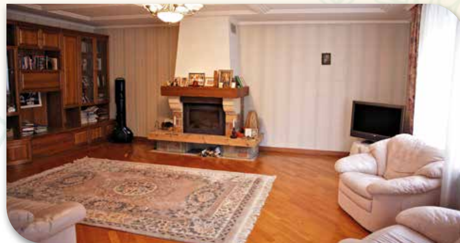
Уютный зал с камином 30 м 2