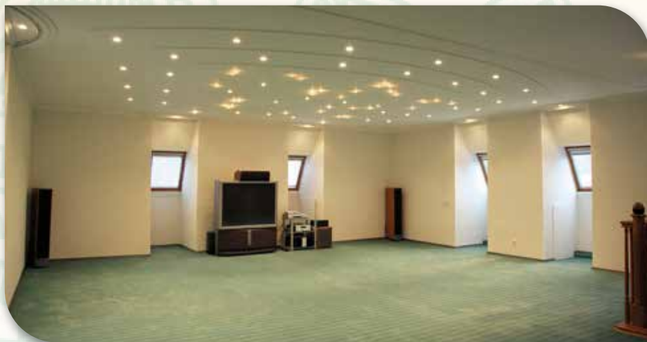
Зал с ковровым покрытием 70 м 2