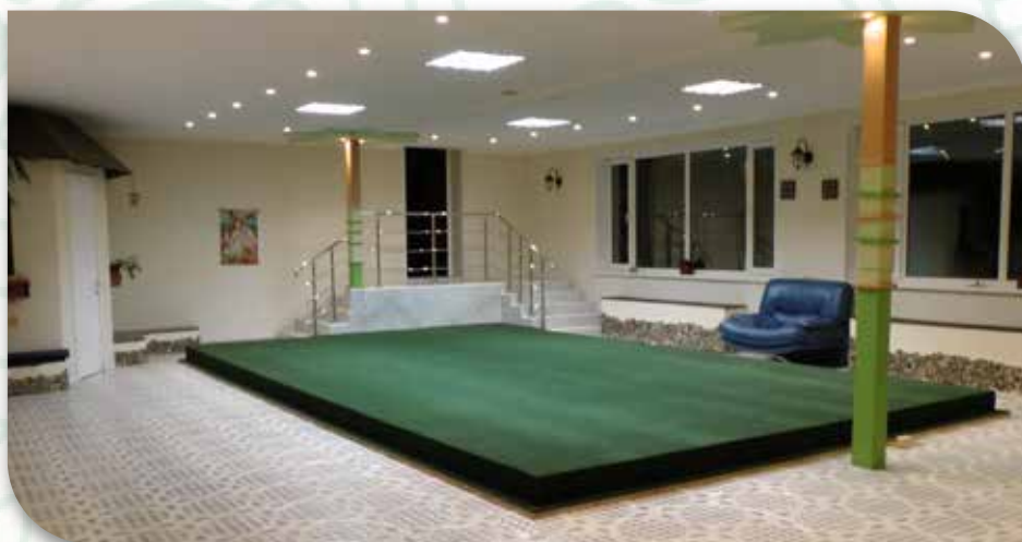
Зал с теплым полом и подиумом 120 м 2