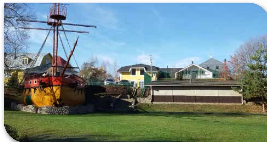
Большая зеленая поляна у реки